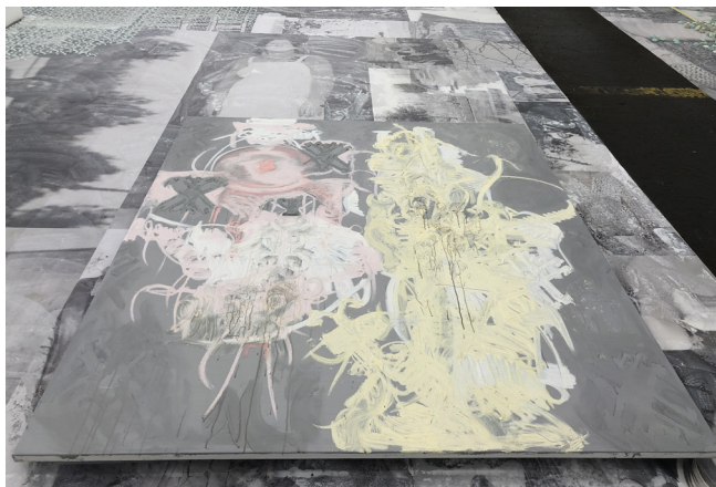
Ebene II: Gemälde und Gipsobjekte