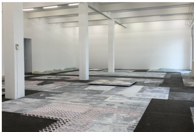
Ebene III: «Emine`s Garden»