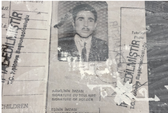
Ebene I: Fotografien

Im Folgenden wird die Ausstellung unterteilt auf drei Ebenen erläutert. Die erste Ebene gilt den Fotografien. Die Fotos liegen als Foliendrucke direkt auf dem Boden der Kunst Halle Sankt Gallen und sind mit einer dünnen Schicht Farbe lasiert. Die zweite Ebene behandelt die Gemälde Melike Karas und die Gipsobjekte, die auf den Fotos liegen. Die dritte Ebene widmet sich dem Thema 'Garten'. Hier liegt der Fokus auf der gesamten, raumgreifenden Installation Karas.